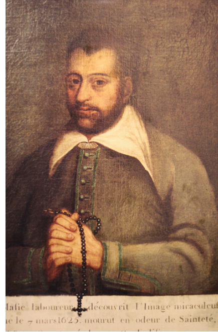
Trésor - Portrait sur toile

Extrait du livre de Cécile Perrochon « Sainte-Anne-d'Auray - Histoire d'un sanctuaire en pays breton de 1625 à nos jours »